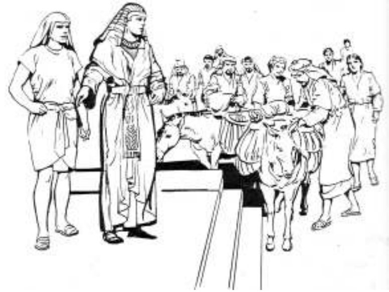
زم يوسف نوڪر نٿ ڪيڏو تو،

يُوسف هُرمي گُيو جي اُو ڪي ڪٺ ربا پڻ اُوئون نٿ ڪئين ڪڙ نه پڙئي جي اُو هُرمٿه ريو ڪم تو اُوئون ٿي واتون ڪرتون يوسف آڀري ٻولي ۾ نٿو ٻولتو پڻ ٻيڙو منڪ يوسف ريون واتون رو ترجمو ڪرين اُوئون نٿ هَمپڙاوتو.